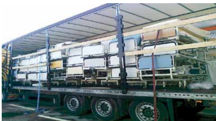
Egy kamionban 42 db kórházi ágy matracokkal és éjjeliszekrénnel érkezett a kórházakba.

Megjegyzés: az ágyakon kívül matracok, éjjeli szekrények, egyéb bútorok és a gyógyításhoz, ápoláshoz használható felszerelések, anyagok is érkeztek a kórházakba.