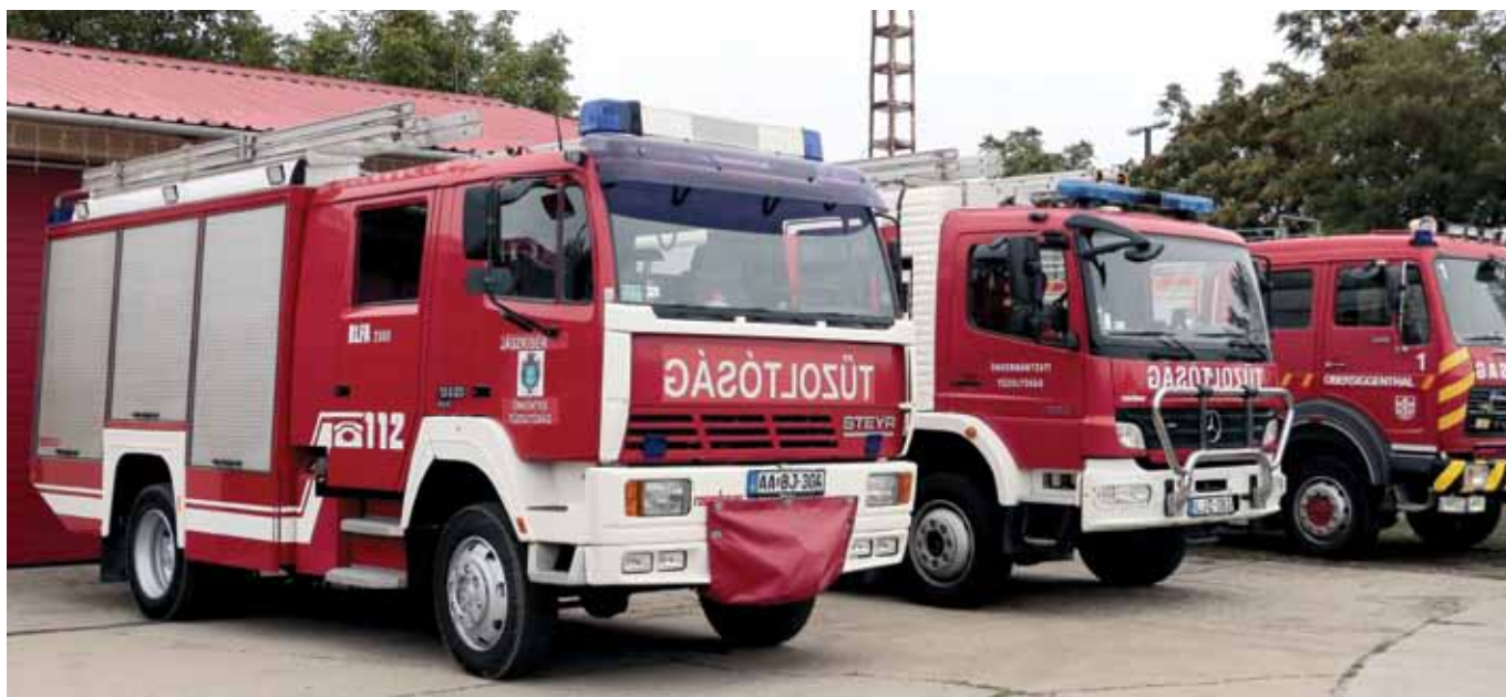
A STEYER is beállt a sorba

Sajnos 2009-óta nem volt lehetőség nagyértékű technikai pályázaton új gépjárműfecskeendőhöz jutni. A több mint 100 milliós beszerzési érték miatt önerőből ilyen beszerzésről nem lehet szó. A Svájcban 2003-ban adományként kapott tűzoltóautó életkora miatt szükségessé vált egy fiatalabb, jobb műszaki állapotú jármű beszerzése. Az Önkéntes Tűzoltó Egyesület 2021-ben úgy döntött, hogy Ausztriából szeretne vásárolni egy megfelelő tűzoltóautót. Állami forrást ehhez nem kaptak, az önkormányzatokat sem akarták terhelni a működésen túli kiadásokkal. „Vásároljunk közösen egy új tűzoltóautót” mottóval adománygyűjtést hirdettek. Kérték a védett települések lakosait és gazdasági szereplőit, hogy lehetőségeik szerint járuljanak hozzá a vásárláshoz. A gyűjtés sikeres volt így 2022-ben 13 millió forintért sikerül megvásárolni a STEYER 13S23 gépjárműfecskeendőt. Hálával gondolnak az ausztriai Plöcking tűzoltóira, akik gondos használói voltak az elmúlt 25 évben az autónak és kiváló műszaki állapotban tudták Jászkisérnek eladni. A svájci tűzoltóautót üzemképes állapotban vásárolták meg Vál önkéntes tűzoltói.