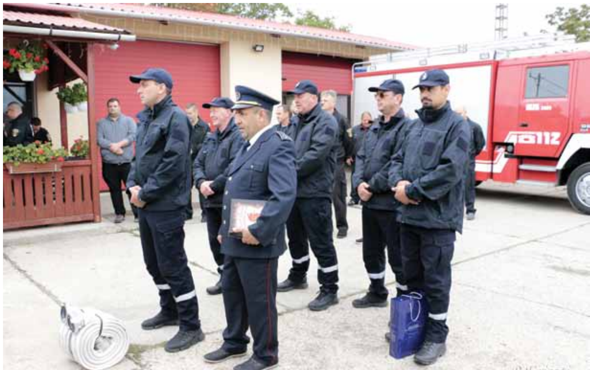
Bácskossuthfalvai tűzoltók Jászkiséren