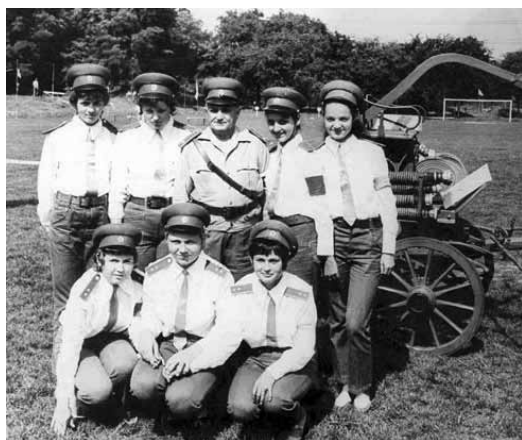
A versenyző lánycsapat 1974

Hosszú éveken keresztül a létesítményi kategóriában a MÁV csapata nagyon eredményesen szerepelt a különböző versenyeken. A versenyekre felkészítettek és vittek gyermek és ifjúsági lány és fiú csapatokat is.