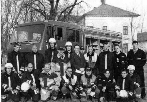
Svájci tűzoltókkal a Polgármesteri Hivatal előtti téren 2003-ban

Akik figyelemmel kísérik a Jászkiséri Tűzoltóság fejlődését 2003-ban tanúi lehettek a Svájcban adományként érkezett tűzoltóautó fogadásának is.