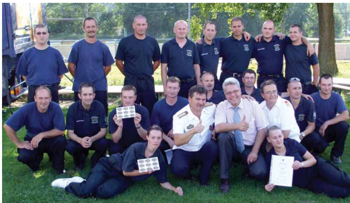
Jászkisér ÖTE és Jászsalsószentgyörgy ÖTE versenycsapatai Warthausenben