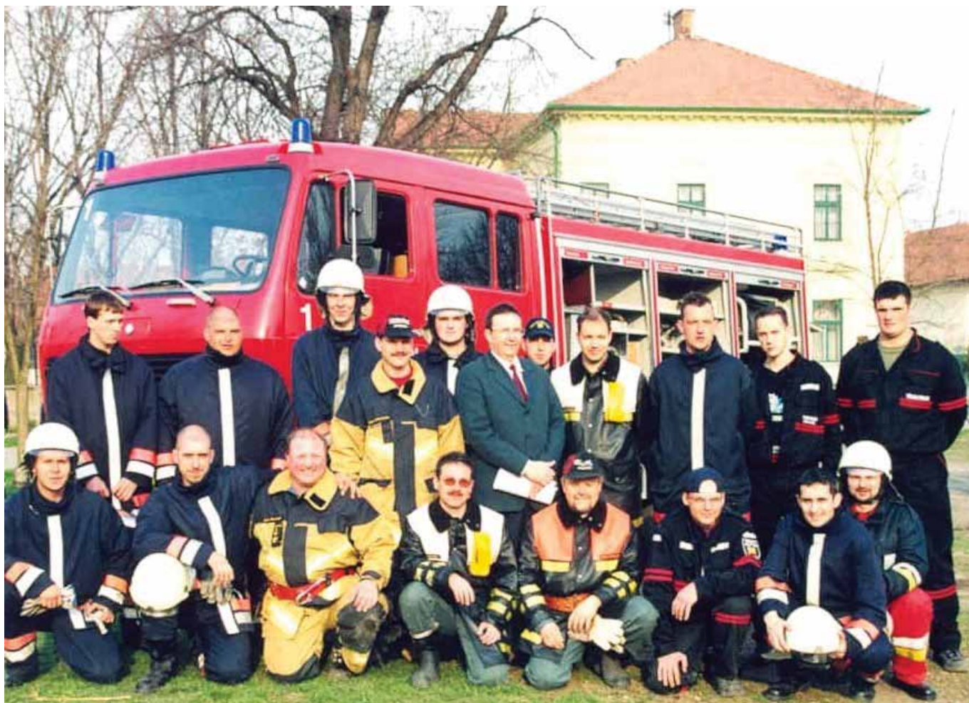
Magyar és svájci tűzoltók az adomány autó előtt

2003-ban a Megyei Önkormányzat Képviselő-testülete az egyesületnek a „Jász-Nagykun-Szolnok Megyei Rendészeti és Közbiztonsági Díj” elismerést adományozta.