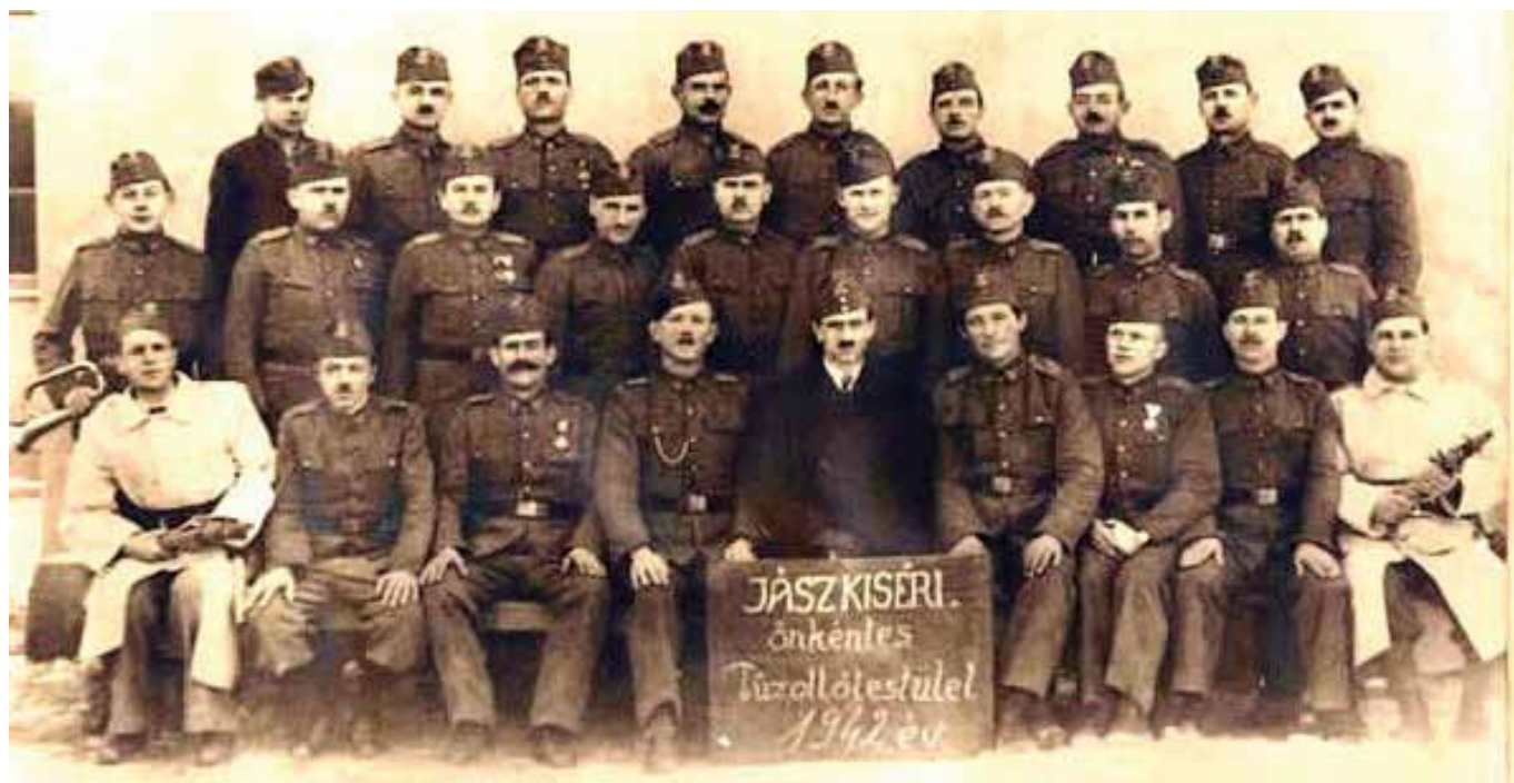
Az alapítókról készült fénykép ma is megtalálható a tűzoltólaktanyában.