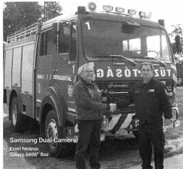
Samsung Dual Camera Ezzel fotózva: Galaxy A406 800

Nem a tűzoltókon múlt, hogy mégsem mehetett nyugdíjba. Sajnos a jászkisérihez hasonló vagy még rosszabb körülmények között sok önkéntes tűzoltóság működik az országban. Ezt az is igazolja, hogy a Magyar Falu Program keretében lehetett használt tűzoltóautó vásárlására is pályázatot beadni. Ezen Vál Tűzoltó Egyesülete támogatást nyert, amiből megvásárolták a mi öreg autónkat. Ott kezdi harmadik életét. Tartalék szerepkörben váltja ki a nála még öregebb, kevésbé modern tűzoltóautót.