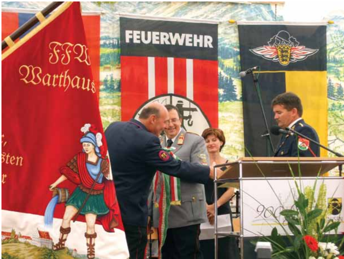
A jászkiséri tűzoltók szalagot vittek Warthausen csapatzászlajára.