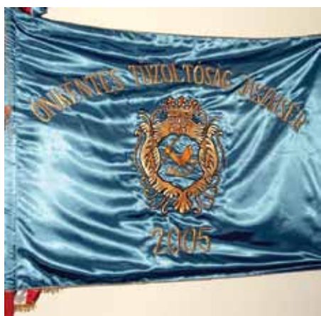
Az önkormányzatok által 2005-ben adományozott csapatzászló