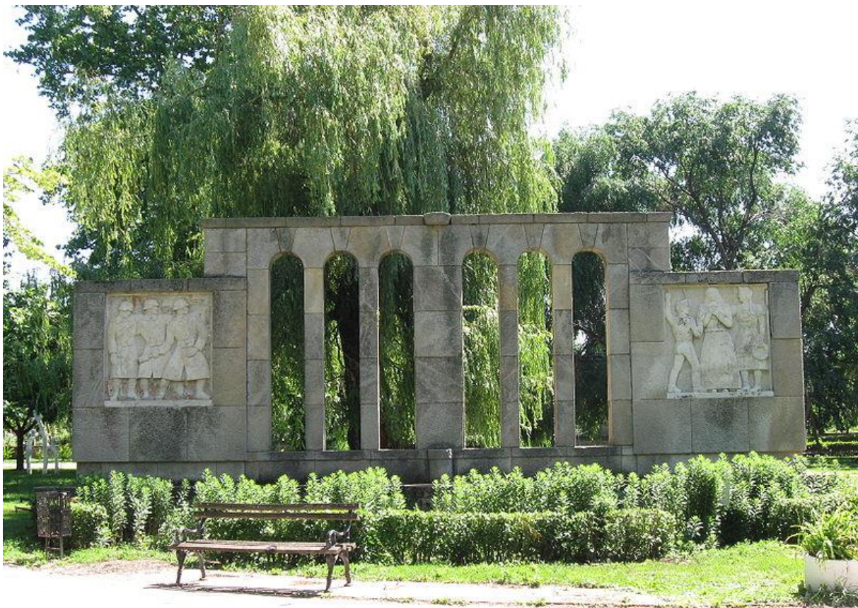
Első világháború elesett áldozatainak emlékműve