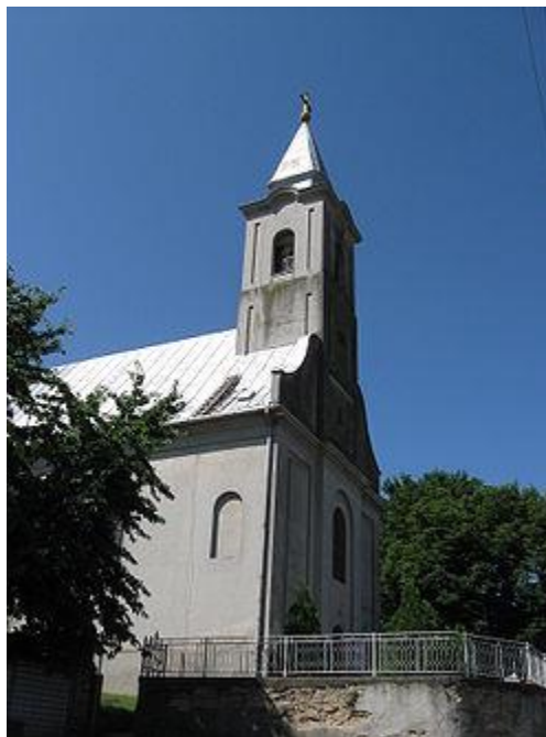
Római Katolikus templom