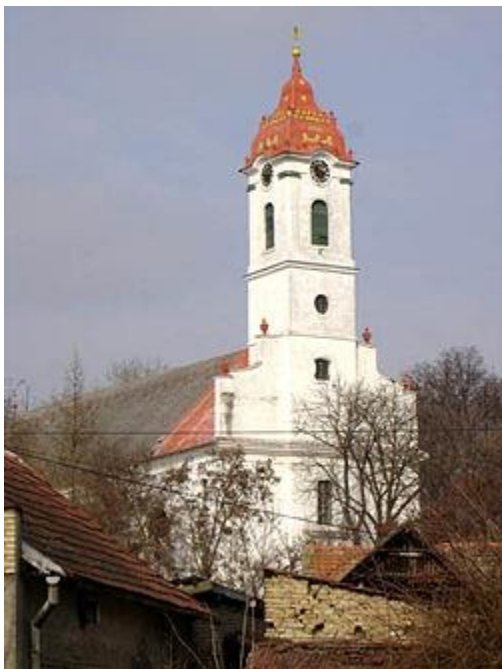
A református templom

Tisztelettel Kérem a Települési Értéktár Bizottságot, hogy a fent leírtak alapján „ a Jászkisériek Bácskai kirajzásának történetét ” vegye fel a Települési Értéktárba.