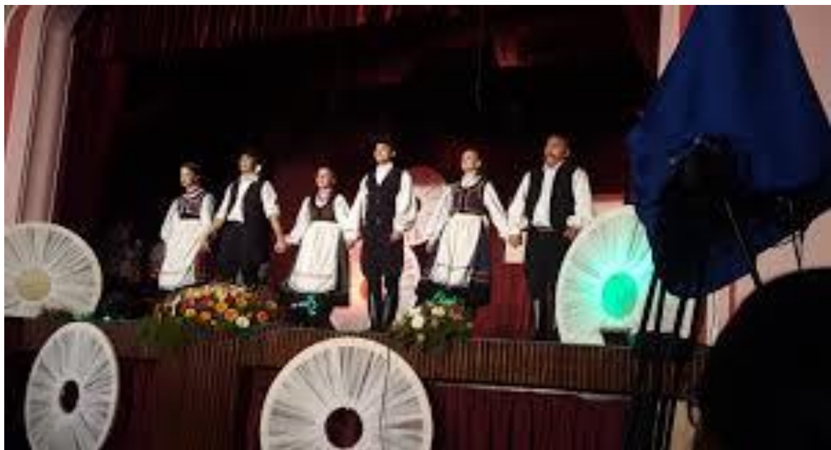
Bácskossuthfalván jártunk – Pendzsom Néptámcegyesület