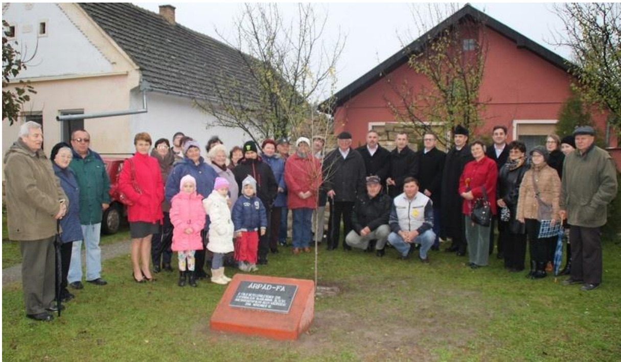
Lezárult a betelepedés 230. éves évfordulójára emlékező rendezvénysorozat