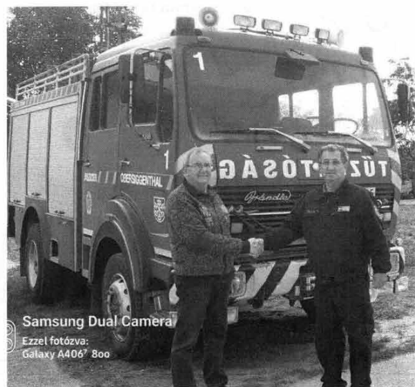
Samsung Dual Camera Ezzel fotózva: Galaxy A406 800

Nem a tűzoltókon múlt, hogy mégsem mehetett nyugdíjba. Sajnos a jászkisérihez hasonló vagy még rosszabb körülmények között sok önkéntes tűzoltóság működik az országban. Ezt az is igazolja, hogy a Magyar Falu Program keretében lehetett használt tűzoltóautó vásárlására is pályázatot beadni. Ezen Vál Tűzoltó Egyesülete támogatást nyert, amiből megvásárolták a mi öreg autónkat. Ott kezdi harmadik életét. Tartalék szerepkörben váltja ki a nála még öregebb, kevésbé modern tűzoltóautót.