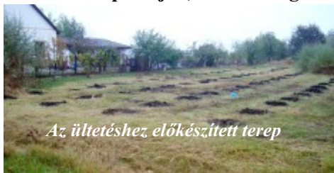
Az ültetéshez előkészített terep

Itt hívjuk fel a figyelmet, hogy lehetősége van a lakosságnak telken belül ültetendő növények igénylésére, a polgármesteri hivatal portáján, az ott megtalálható listán szereplő növényekből.