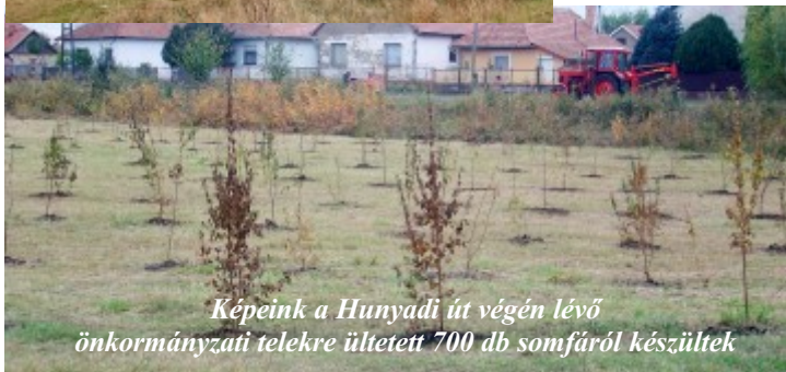
Képeink a Hunyadi út végén lévő önkormányzati telekre ültetett 700 db somfáról készültek

Személyenként 5 növény igényelhető. Az Önkormányzat feltételként szabja, hogy csak a lakókörnyezet „zöldítésére” lehet felhasználni, amit a későbbiekben ellenőrizni fognak.